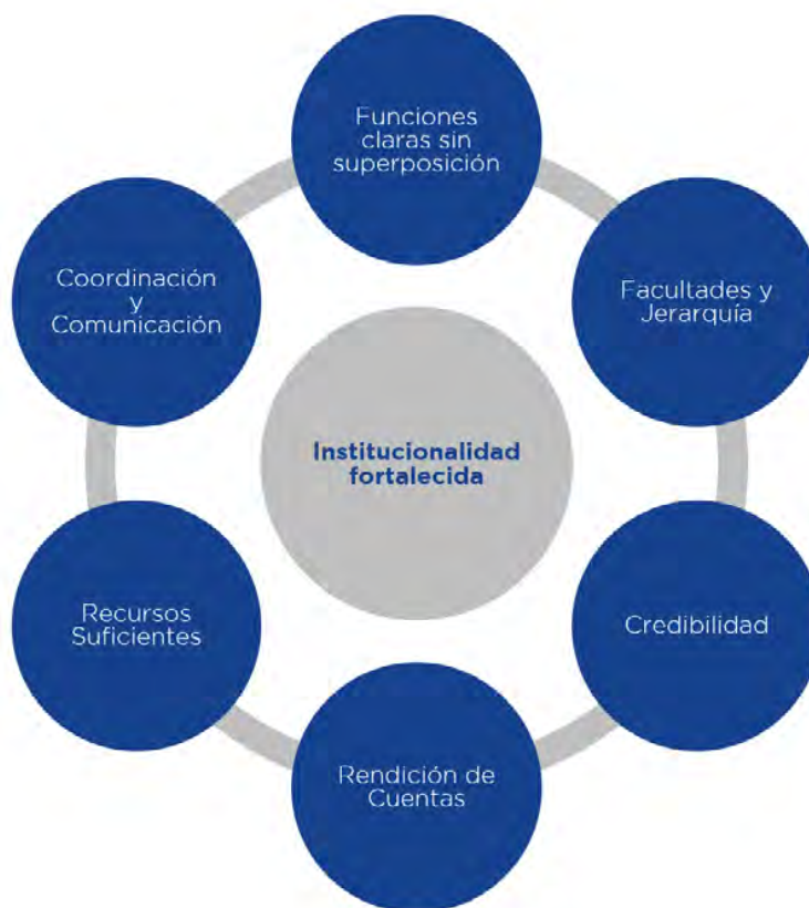
Figura 1. Principios Estratégicos de evaluación para una institucionalidad fortalecida

Si bien no es posible una institucionalidad perfecta, los principios enunciados permiten identificar debilidades y las acciones para fortalecer lo que es prioritario y necesario para la implementación efectiva y exitosa de las estrategias para la transición energética.