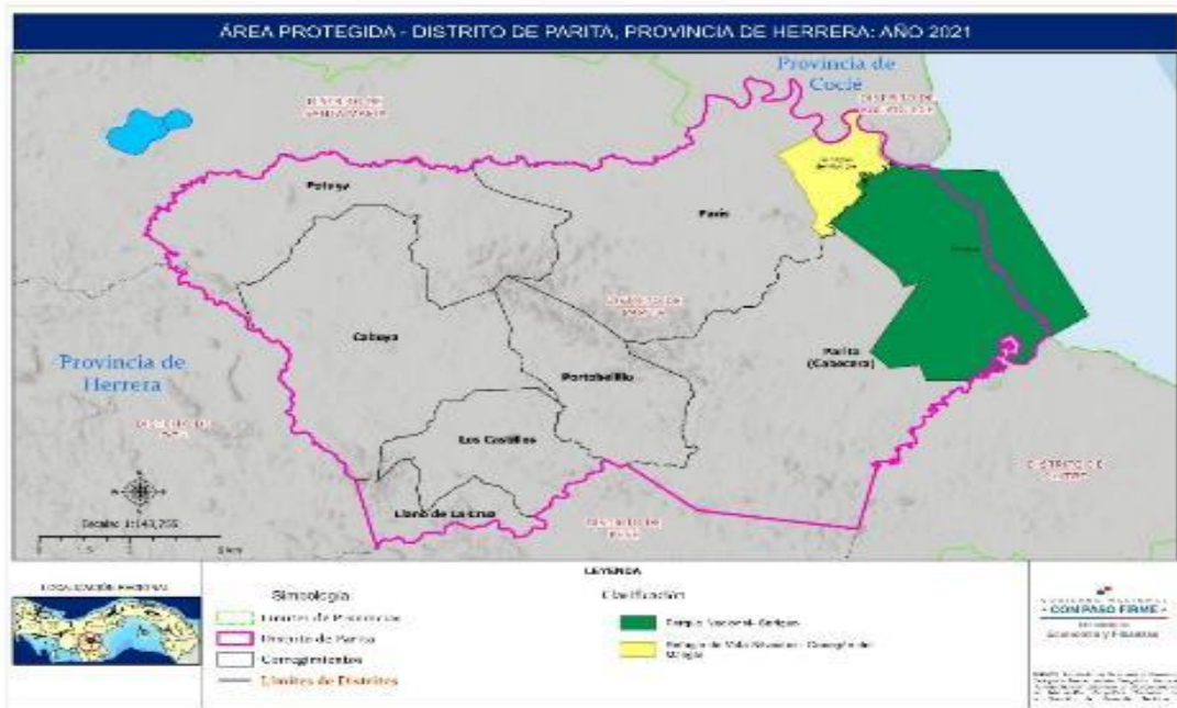
MAPA 5. ÁREAS PROTEGIDAS DEL DISTRITO DE PARITA, PROVINCIA DE HERRERA, AÑO 2021