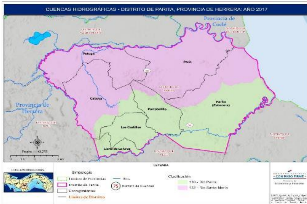
MAPA 3. CUENCAS HIDROGRÁFICAS DEL DISTRITO DE PARITA, PROVINCIA DE HERRERA, AÑO 2017