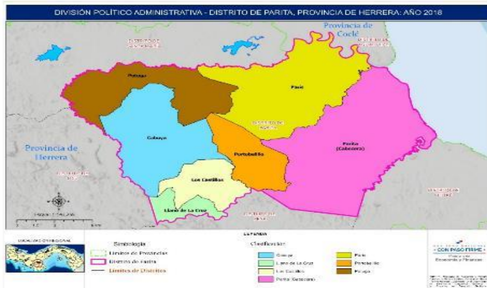
MAPA 2. DIVISIÓN POLÍTICA ADMINISTRATIVA DEL DISTRITO DE PARITA, PROVINCIA DE HERRERA, AÑO 2018.