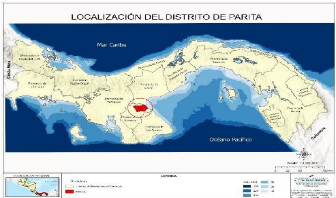
MAPA 1. LOCALIZACIÓN DEL DISTRITO DE PARITA, PROVINCIA DE HERRERA, AÑO 2018