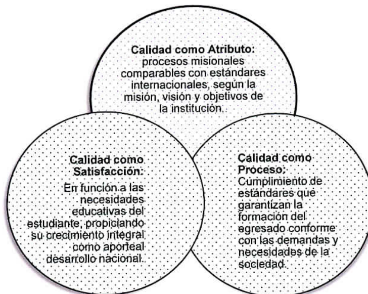
Figura 3. CONEAUPA. Criterios de calidad.

En el entendido que “el propósito de la gestión de calidad es avanzar sistemáticamente a niveles crecientes de calidad dentro de una institución de educación superior, la acreditación certifica y da fe pública del grado de satisfacción de los propósitos declarados (misión, visión, valores), en relación con los actores pertinentes, grupos de interés, su contexto y entorno, en una institución, en función de un conjunto de estándares definidos y normados, vigentes. La evaluación constituye la estrategia que impulsa el cambio y la mejora. Los procesos de cambio no son únicos, ni se establecen de manera general para todos, responden a procesos internos en cada institución, de acuerdo con sus particularidades, a su diversidad. Por su parte, la acreditación establece hitos en el camino de la mejora continua”.