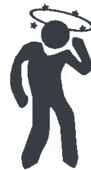
Dolor de cabeza y de garganta