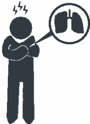
Síndrome respiratorio agudo severo