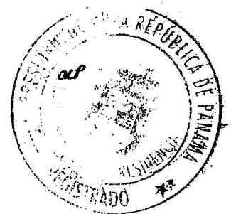
CARLOS E. RUBIO Ministro de Gobierno, encargado