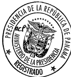
JUAN CARLOS VARELA RODRÍGUEZ Presidente de la República

Dado en la ciudad de Panamá, a los 28 días del mes de Septiembre de dos mil dieciséis (2016)