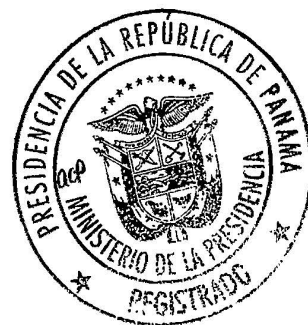
JUAN CARLOS VARELA RODRÍGUEZ Presidente de la República

Dado en la ciudad de Panamá, a los 20 días del mes de Julio de dos mil dieciséis (2016).