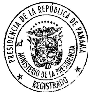
JUAN CARLOS VARELA RODRÍGUEZ Presidente de la República

Dado en la ciudad de Panamá, a los 22 días del mes de Julio de dos mil dieciséis (2016).