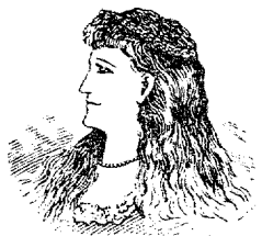
Marca Comercial Registrada

Registrada: Renovación número 246.977, válido por veinte años a partir del 6 de noviembre de 1928, para amparar la fabricación de preparaciones para el tratamiento de las enfermedades peculiares de las mujeres.